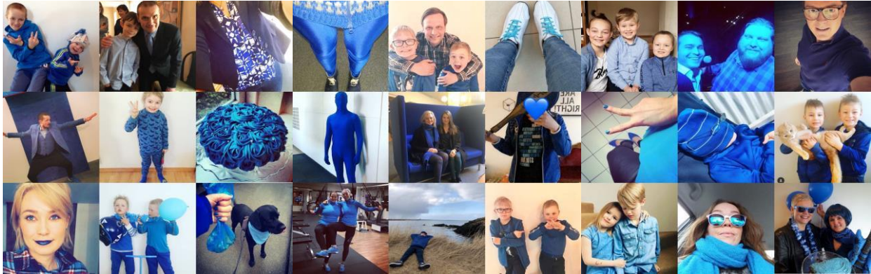
Myndir frá Bláa deginum undanfarin ár #blarapril

Í tilefni af vitundar- og styrktaráttakinu BLÁR APRÍL sem er nú haldið í sjötta sinn, eru börn og fullorðnir hvattir til að klæðast bláu þriðjudaginn 2. apríl til að sýna einhverfum stuðning og samtöðu. Undanfarin ár hafa margir brugðið á það ráð að birta myndir á samfélagsmiðlum með myllumerkinu #blarapril sem hefur lífgað upp á daginn og hjálpað til við að breiða út boðskapinn