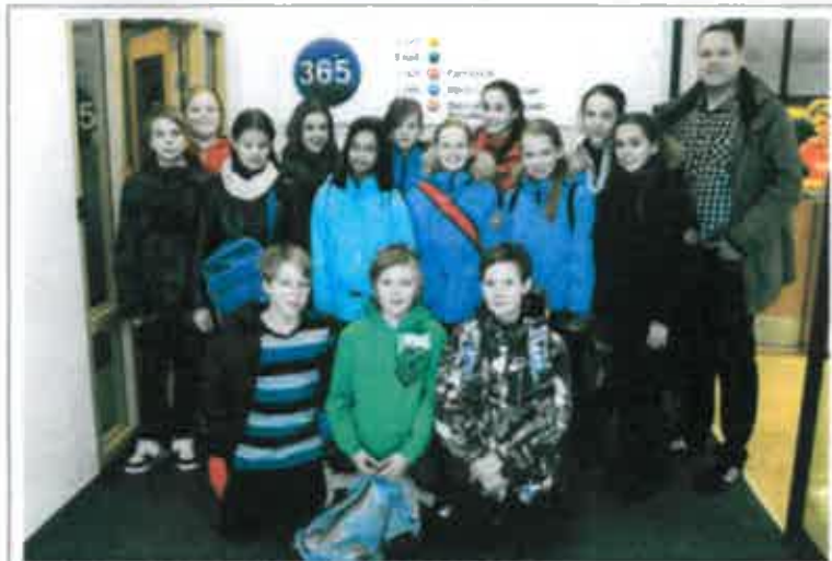
SKEMMTILEG HEIMSÓKN ÚR GARDABÆ Þessi flotti hópur krakka úr 7-ÓP í Hofstaðarskóla heimsótti 365 miðla í dag. Þau fengu kynningu um alla fjölmöla og heimsóttu meðal annars hjóðver FM975.