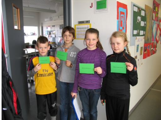
Umhverfigæslan að störfum

Í umhverfisnefndinni hafa verið lagðar helstu línur í umhverfismálunum, umhverfistefnan endurskoðuð og markmið sett. Einn meðlimur í ráðinu tekur að sér fundarstjórn og annar ritar fundargerð (sjá fylgiskjal 1). Nokkrum sinnum eru smærri fundir og vinnufundir með aðilum úr umhverfisnefndinni í tengslum við ýmis konar verkefni.