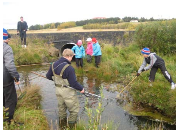
Nemendur í 6. bekk taka sýni úr Vífilsstaðalæk

Útikennsla og fræðsla um umhverfismál eru samofin. Rík hefð er í Hofsstaðaskóla að fara í vettvangsferðir en í tengslum við þær fræðast nemendur meðal annars um umhverfismál. Dæmi um skemmtilegt umhverfisverkefni er Vífilsstaðaverkefnið sem unnið hefur verið í Hofsstaðaskóla frá hausti 2000. Nemendur í 6. bekk læra um lífríkið í og við Vífilsstaðavatn